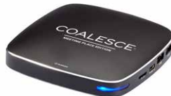
COALESCE™ MEETING PLACE EDITION (WC-COA-MPE)

Für die Präsentation oder die ortsübergreifende Teilnahme an einer Besprechung.