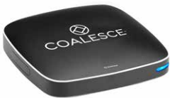
COALESCE™ PROFESSIONAL (WC-COA-PRO)

Mit seinen umfangreichen Funktionen, seiner Anpassbarkeit und Benutzerfreundlichkeit erfüllt Coalesce die Anforderungen kleinerer Unternehmen mit Arbeitnehmern an entfernten Orten und größerer Unternehmen, die Besprechungen in vielen verschiedenen Räumen, Büros und Bereichen abhalten.